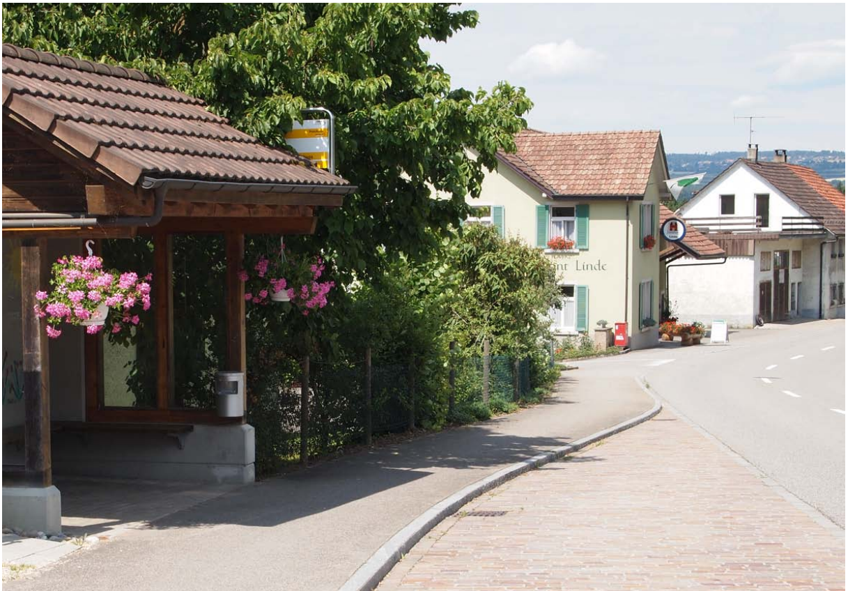
Abb. 7: Der Öffentliche Verkehr schafft Verbindungen in die Region