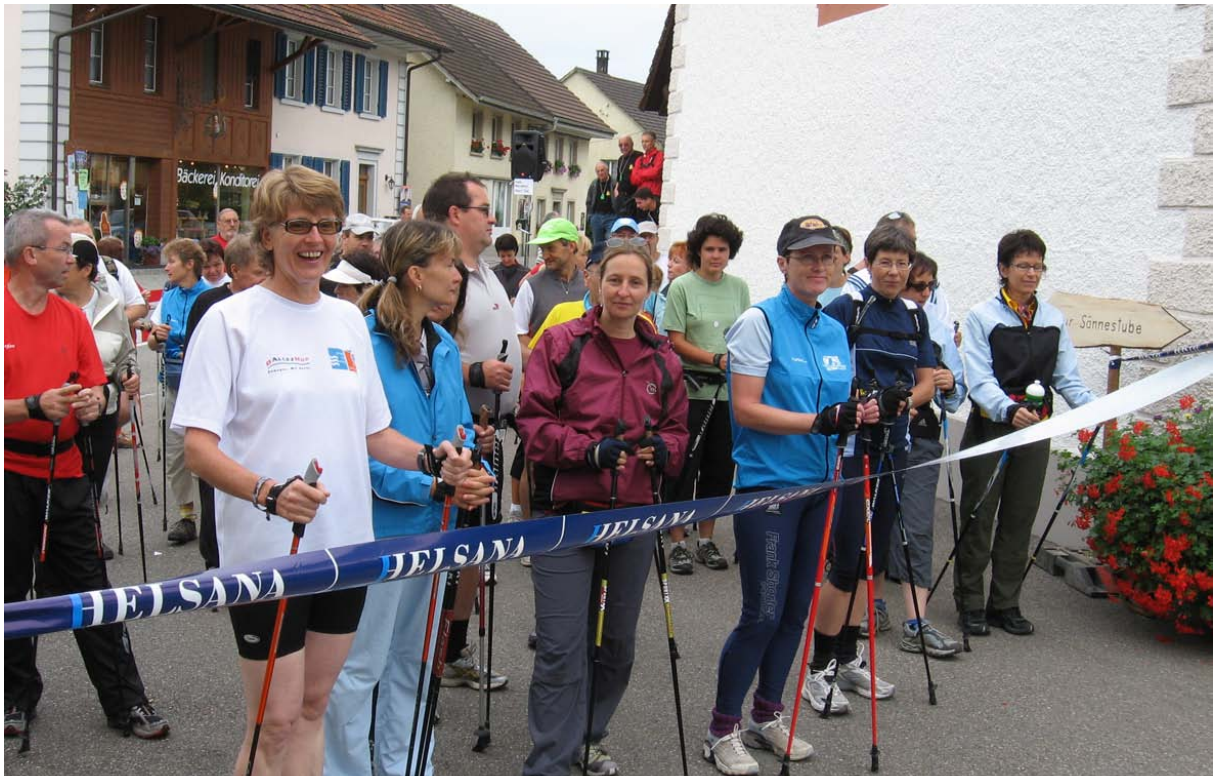
Abb. 3: Aktiv sein und die Natur erleben im Mettauertal