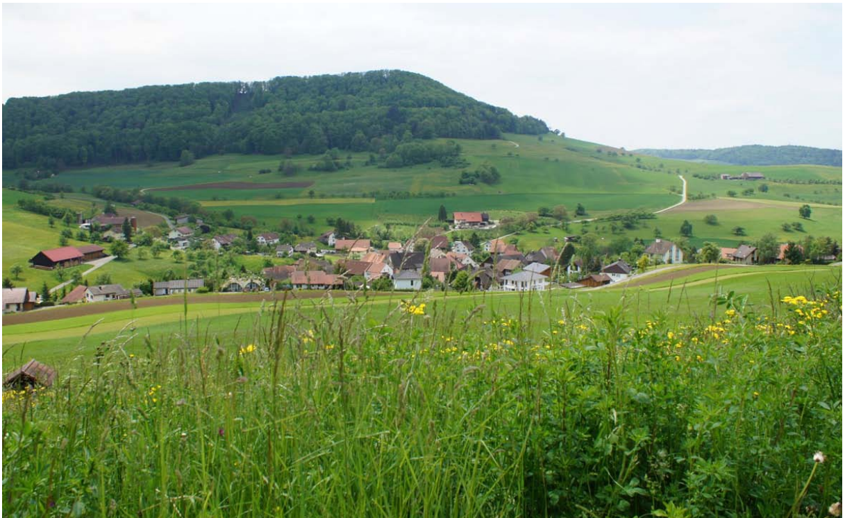
Abb. 8: Der Ortsteil Hottwil bettet sich ins Landschaftsbild ein