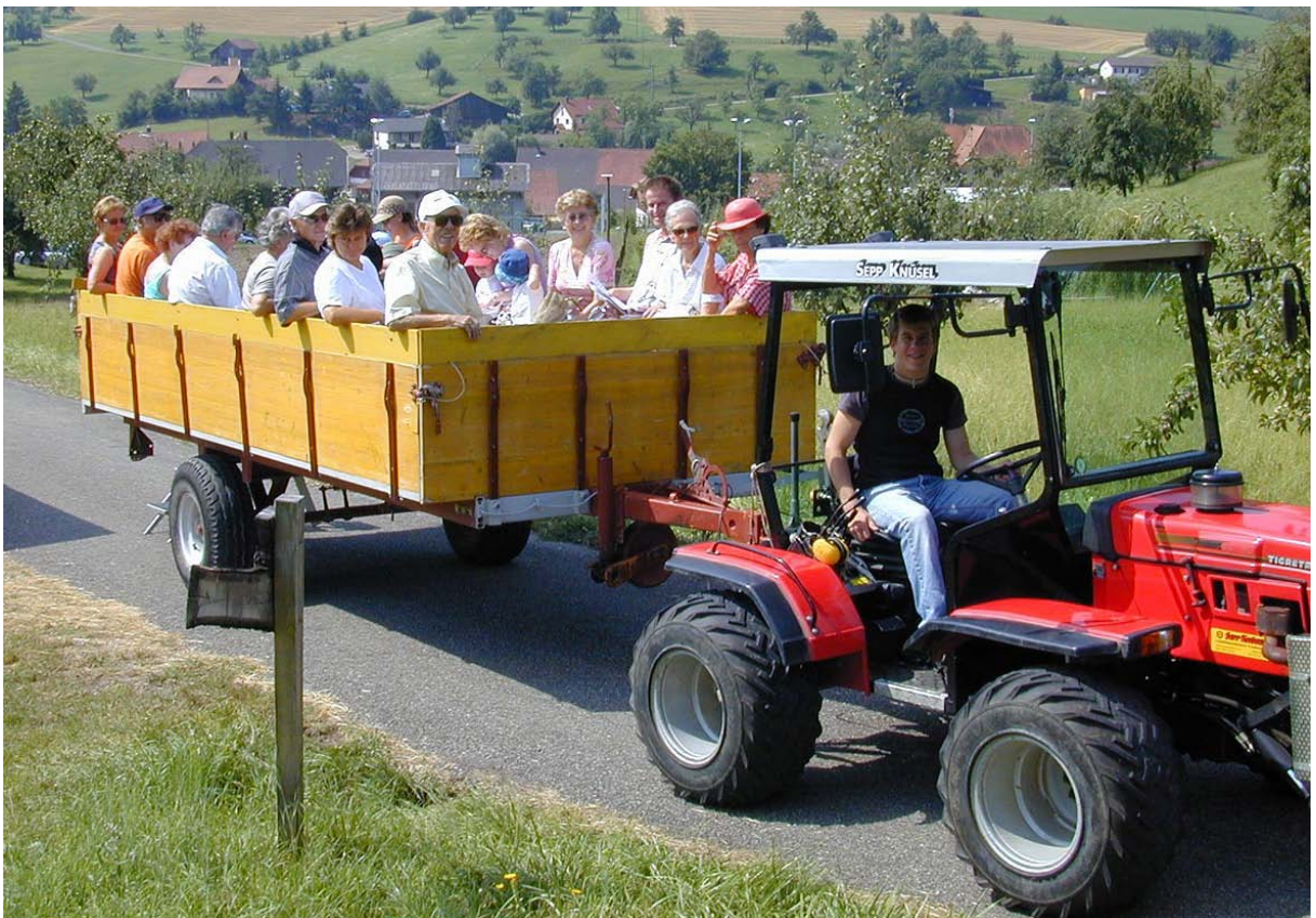
Abb. 5: Senioren geniessen die schöne Landschaft im Mettauertal