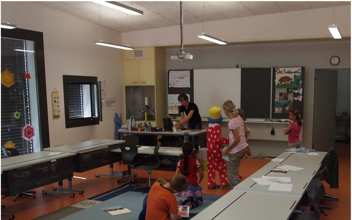
Abb. 4: Blick in den Unterricht an der Primarschulstufe