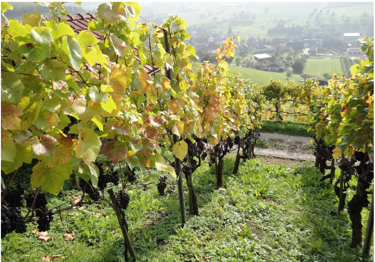
Abb. 6: Reben und Wein – landschaftstypische Elemente im Mettauertal