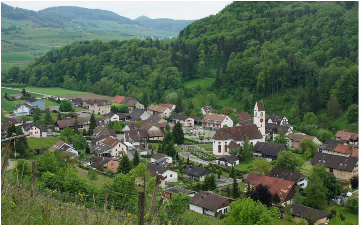
Abb. 1: Der Ortsteil Mettau beherbergt das neue Verwaltungszentrum