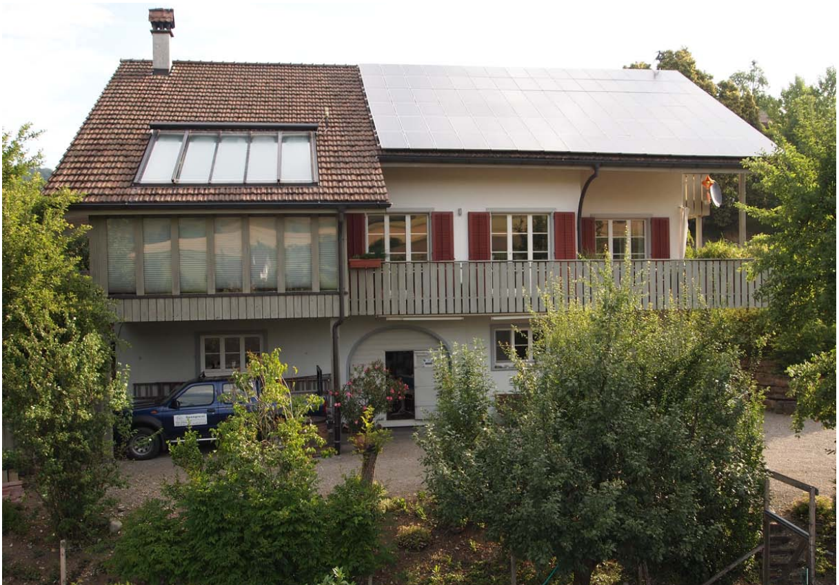
Abb. 9: Die Nutzung erneuerbarer Energien schont unsere Ressourcen