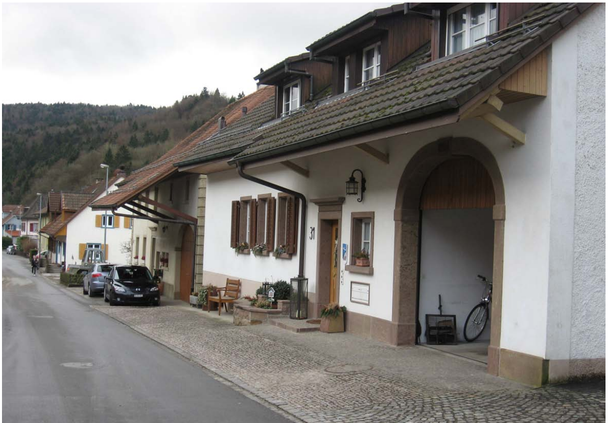
Abb. 2: Hohe Lebensqualität - auch in den Ortszentren