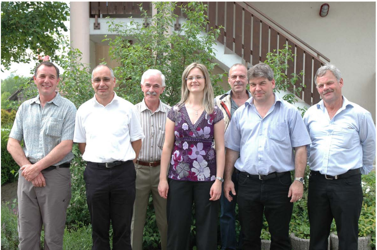
Abb. 11: Die Mitglieder des Gemeinderates sind gerne für die Bevölkerung da