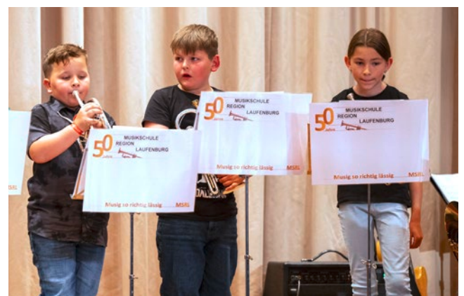
Jubiläumskonzert MSRL 2025.