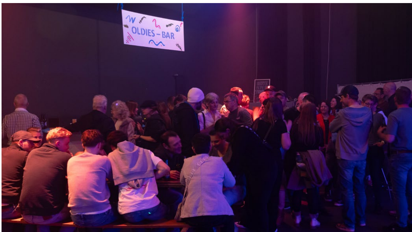
Verweilen in der Oldies-Bar.

Der TSV Mettauertal dankt allen Besucherinnen und Besuchern für ihr Kommen und den Sponsoren für die grosszügige Unterstützung. Die Vorfreude auf das nächste Jahr ist bereits jetzt geweckt.