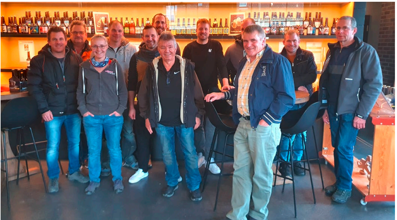
Verein IG pro Landwirtschaft Mettauertal.

einzelnen Schritte von der Anlieferung der Rohstoffe, Malz und Hopfen, zur Gärung und schlussendlich zum Abfüllprozess wurden detailliert erklärt. Anschliessend folgte der Rundgang durch die Produktion – von der Würzpfanne über die Lagertanks bis hin zur Abfüllung der Flaschen. Nicht fehlen durfte die Degustation von einigen Biersorten sowie die Möglichkeit, die Favoriten direkt vor Ort zu erwerben.