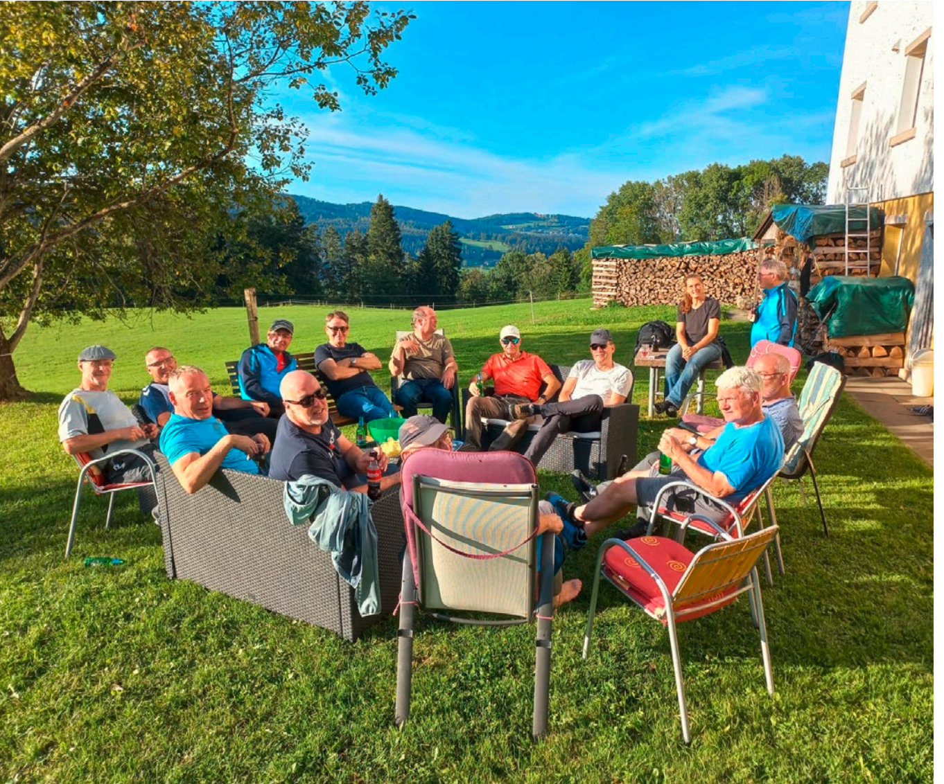
MTV Wil auf seiner Vereinsreise.