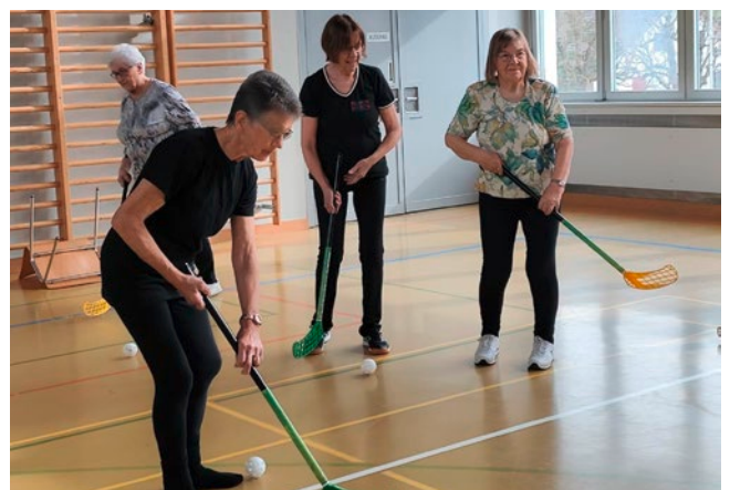
Die aktiven Turnstunden sind abwechslungsreich.